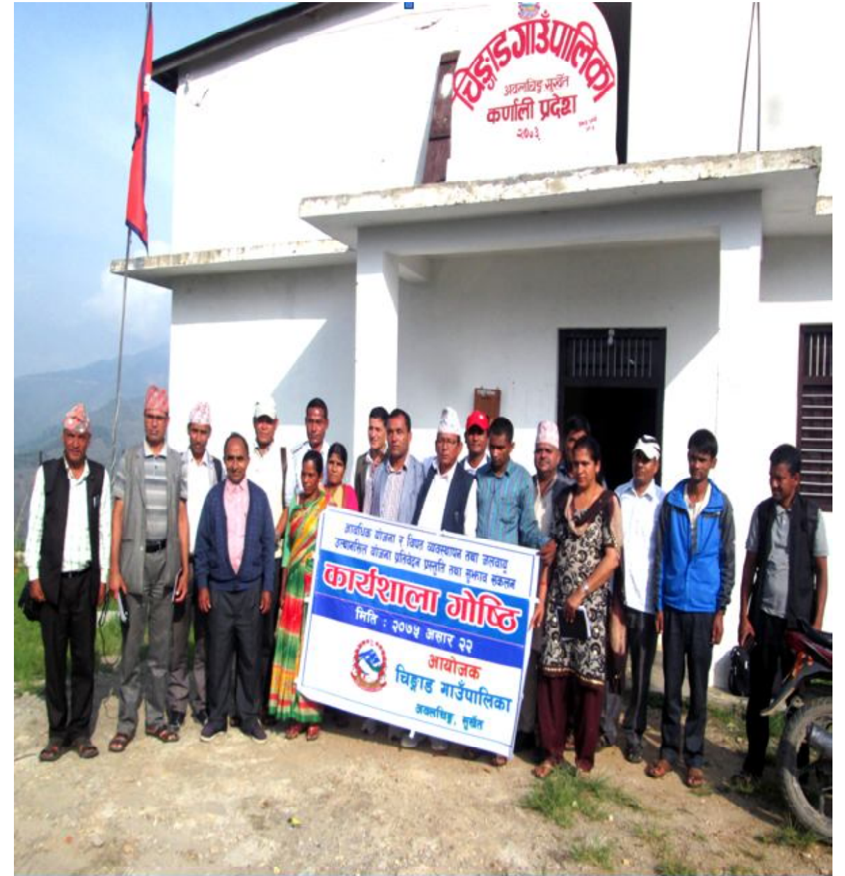
चिङ्गाड गाउँपालिकाको आवधिक योजना अन्तिम कार्यक्रम २०७५/०३/२२